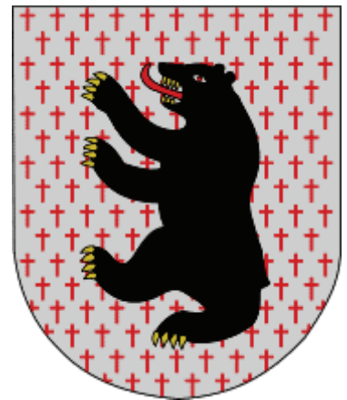
7 pav. Meškuičių herbas, patvirtintas 1999 m. Herbo etalono autorius – Saulius Bajorinas (Rimša, E. Lietuvos heraldika . Vilnius, 2008, p. 282)