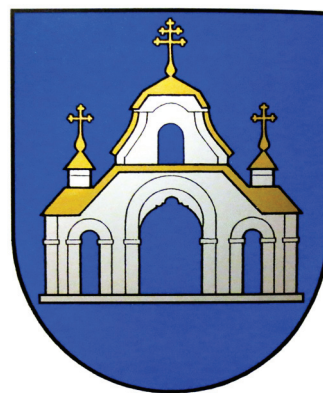
2 pav. Šaukėnų herbas, patvirtintas 1999 m. Herbo autorius – Juozas Galkus (Rimša, E. Lietuvos heraldika . Vilnius, 2008, p. 404)

Toks herbas buvo patvirtintas 1999 m. gegužės 7 d. Etalono autorius – dail. Juozas Galkus. E. Rimša knygoje „Lietuvos heraldika“ teigia, kad kasdieniame gyvenime vartai reiškia patikimą apsaugą, o dvasiniame – perėjimą iš vienos būties į kitą: iš žemiškosios į dvasiškąją, dieviškąją amžinybę 18 (žr. 2 pav.). Pažymėtina, kad šiame herbe taip pat vaizduojama mėlyna spalva, simbolizuojanti ištikimybę, dieviškąją išmintį, pastovumą; sidabrinė – turtą, dorumą, skaistumą, nekaltybę; auksinė – šviesos simbolis 19 .