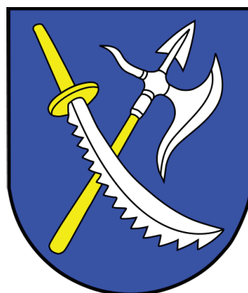
3 pav. Liolių herbas, patvirtintas 2009 m. Herbo etalono autorius – Rolandas Rimkūnas