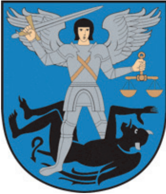
1 pav. Kražių herbas, patvirtintas 1993 m. Herbo autorius – Agnius Tarabilda (Rimša, E. Lietuvos heraldika . Vilnius, 2008, p. 229)

Arkangelas Mykolas, šv. Kazimieras, šv. Petras ir Paulius bei kiti šventieji. Taip pat vaizduojama Dievo Apvaizdos akis – pagrindinis Ketverių metų seimo (1788–1792) ideologinis simbolis. Dažniausiai miestų herbuose ir antspauduose vaizduojama visa stovinčio, rečiau sėdinčio šventojo figūra (portretas) su jam būdingais atributais. Pavyzdžiui, Vilniaus šv. Kristoforas neša kūdikėlį Jėzų. LDK miestų heraldikoje didelę įtaką turėjo ir politinė ideologinė situacija, valstybės globėjai, kartais net konkretūs įvykiai 11 .