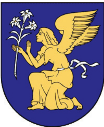
5 pav. Grinkiškio herbas, patvirtintas 1999 m. Herbo etalono autorius – Arvydas Každailis (Rimša, E. Lietuvos heraldika , Vilnius, 2008, p. 170)

Liolių herbas yra pats naujusias iš visų trijų Kelmės rajono miestelių herbų. Lietuvos Respublikos Prezidentė šį herbą patvirtino 2009 m. rugpjūčio 11 d. Heraldikos komisijos posėdyje kartu su seniūnijos atstovais buvo nuspręsta herbe pavaizduoti šventųjų apaštalų Simono ir Judo Tado atributus – lenktą kardą-pjūklą ir alebardą (žr. 3 pav.). Šių apaštalų titulą turi Liolių barokinė bažnyčia, kuri su varpine ir 1853 m. pastatyta kapinių koplyčia įtraukta į Lietuvos architektūros paminklų registrą. Šventieji Simonas ir Judas Tadas buvo I a. apaštalai. Simonas apaštalavo Egipte, o Judas Tadas Mesopotamijoje. Abu šventieji daug keliavo, skleisdami tikėjimą, lankydavosi vienas pas kitą, vėliau kartu išvyko į Persiją skelbti Evangelijos, kur abu buvo nužudyti. Judo Tado atributai yra spėjami jo nužudymo įrankiai – alebarda, lazda ar ietis. Judas Tadas yra patekusiųjų į beviltišką padėtį globėjas. Simonas buvo nužudytas lenktu kardu ar pjūkle. Šv. Simonas – globėjas visų, kurie pjausto medį, marmurą ir t. t. Herbo etaloną parengė dail. Rolandas Rimkūnas 20 . Šiame herbe vaizduojama mėlyna spalva, simbolizuojanti ištikimybę, dieviškąją išmintį, pastovumą; sidabrinė – turta, dorumą, skaistumą, nekaltybę; auksinė – šviesos simbolis 21 .